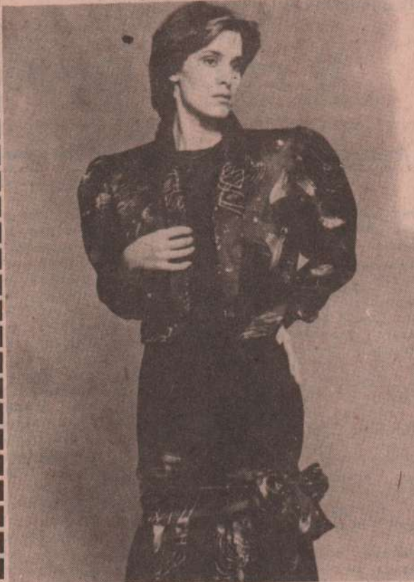
Новый наряд для хозяйки.