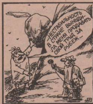
рис. В. Федорова (Челябинск)