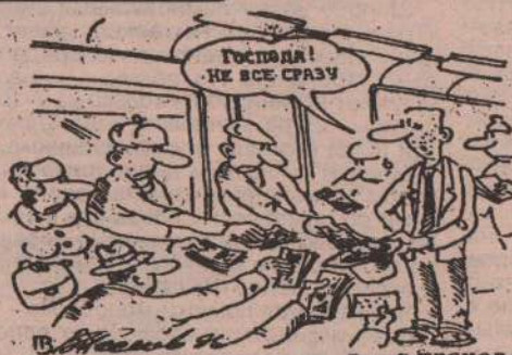
Рис. В. ПЕШКОВА.