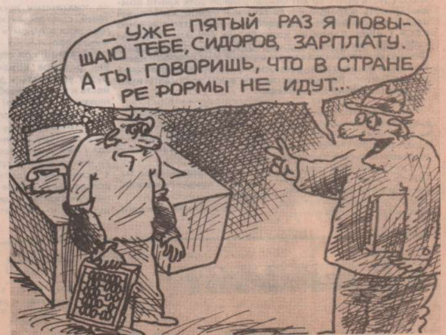
Рисунок В. Федорова.

...ПОДНЯЛАСЬ ТЕМПЕРАТУРА, не надо ее резко сбивать, этим вы только себя ослабите. При высокой температуре погибают вирусы, восстанавливаются многие капиллярные процессы. Не следует много есть, зато очень полезны будут потогонный чай (липа, малина, мед, череда), растирание слабым раствором уксуса, кислое питье (лимон, клюква);