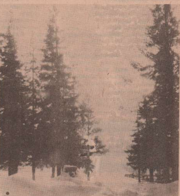
Мороз и солнце...