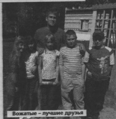
Вожатые — лучшие друзья

Можно даже сказать, что отдыхающие и сотрудники не просто друзья, а одна большая семья. И