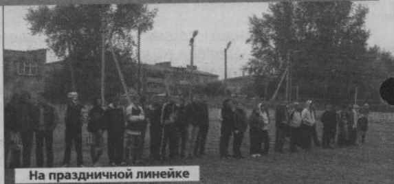
На праздничной линейке