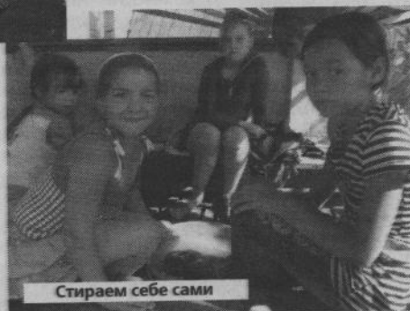
Стираем себе сами