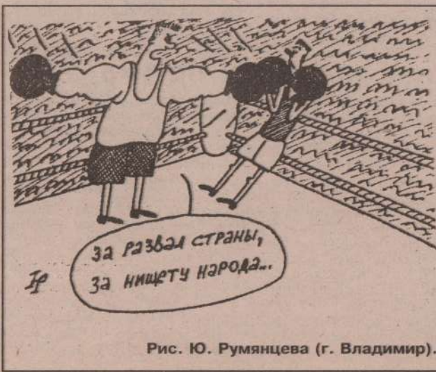
Рис. Ю. Румянцева (г. Владимир).