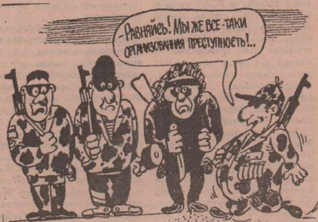
Рисунок Л. ЧЕРНЫХ.