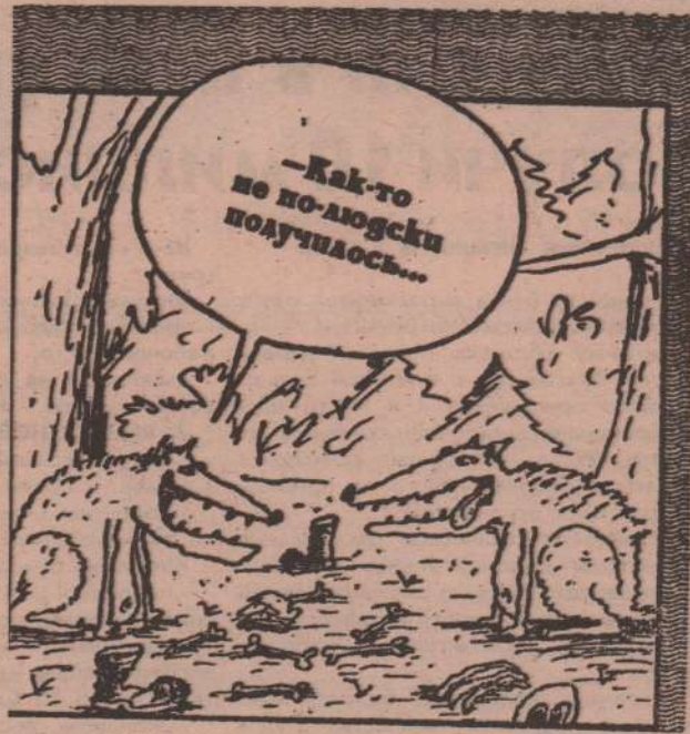
Рис. В. ШИЛОВА (С.-Петербург).