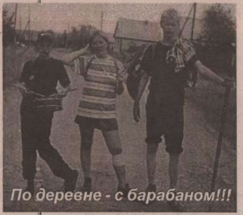
По деревне - с барабаном!!!