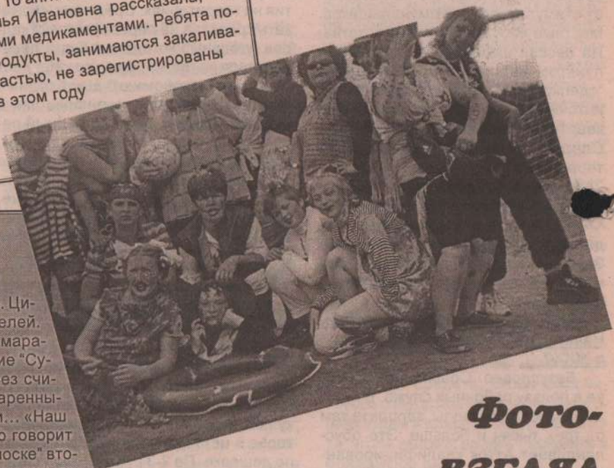
ФОТО-ВЗГЛЯД с первой смены.