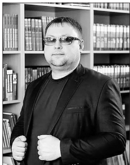
Евгеньевич работает 5 лет.

«Моя работа в УИК началась в 2018 г., тогда я стал членом комиссии. На