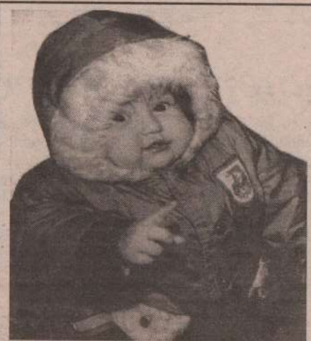
А ты выписал газету «Пламя»?

будет жить легче. Тогда можно было бы и потерпеть. Мечтаю о восстановлении барабановского тракта, тогда бы во многих деревнях (Черемиское, Гашеневое...), имеющих отличную землю, можно было бы садить картофель, который из-за низкого прошлогоднего покупательского спроса нынче не был посажен. Другим территориям было бы интересно узнать, что первоочередникам за первый квартал 98 года