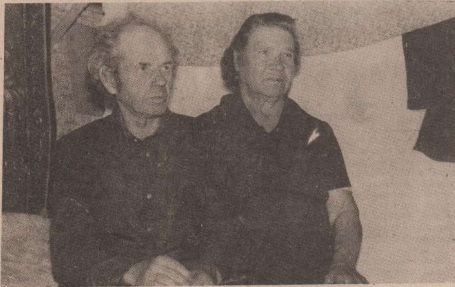
Вот так и живем