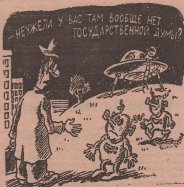
Рис. В. Милейко.