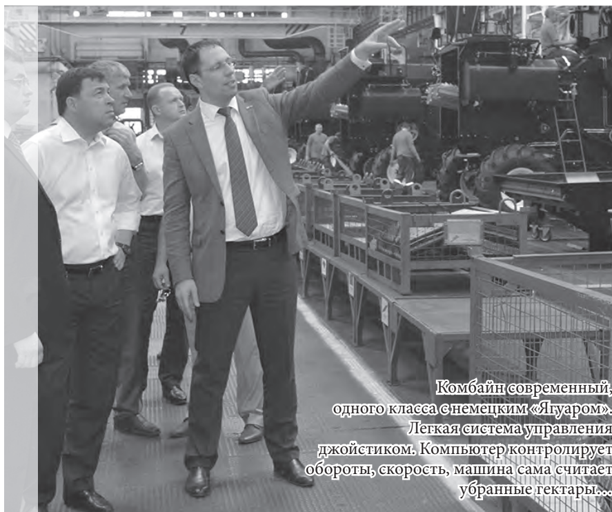
Комбайн современный, одного класса с немецким «Ягуаром». Легкая система управления джойстиком. Компьютер контролирует обороты, скорость, машина сама считает убранные гектары...