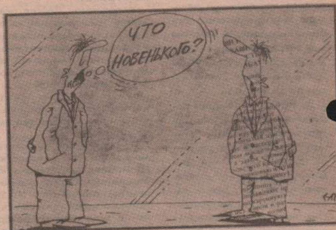
Рисунок А. Пяткова.