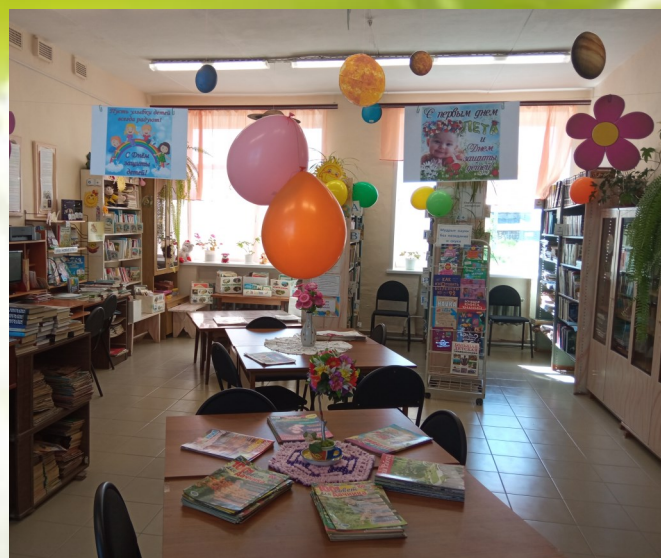
На фото: к празднику готовы!