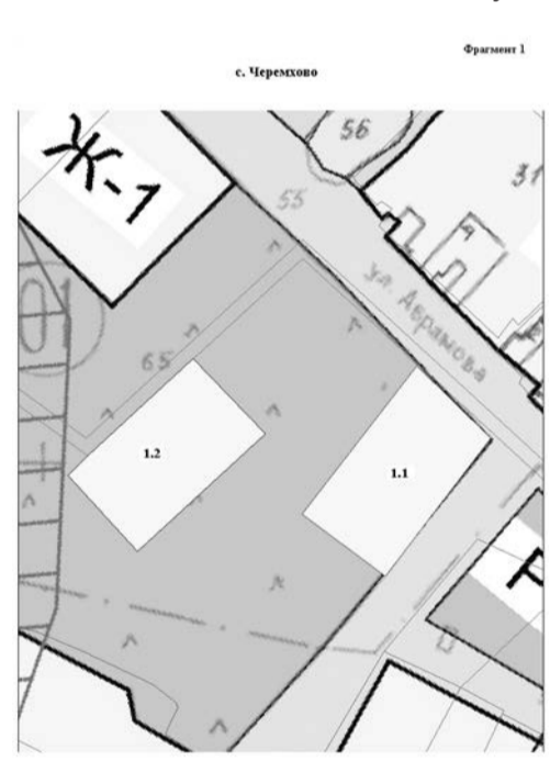
1.1 - земельный участок ул. Абрамова, 16 (изменение зоны Р1 на зону Ж1) 1.2 - земельный участок ул. Абрамова (изменение зоны Р1 на Ж1)