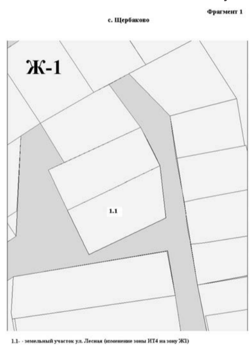
1.1 - земельный участок ул. Лесная (изменение зоны ИТ4 на зону Ж1)