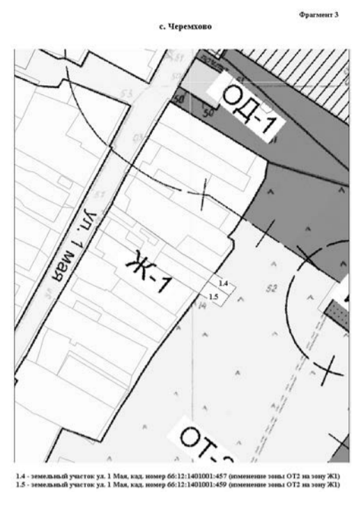
1.4 - земельный участок ул. 1 Мая, кад. номер 66:12:1401001:457 (изменение зоны ОТ2 на зону Ж1) 1.5 - земельный участок ул. 1 Мая, кад. номер 66:12:1401001:459 (изменение зоны ОТ2 на зону Ж1)