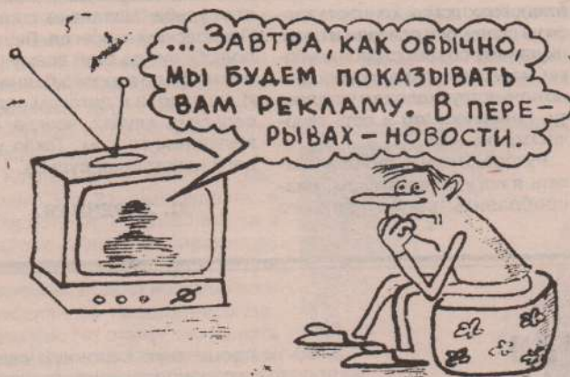
Рис. В. Жабского.