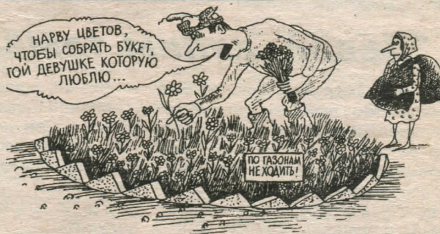
Рис. В. Дубова.