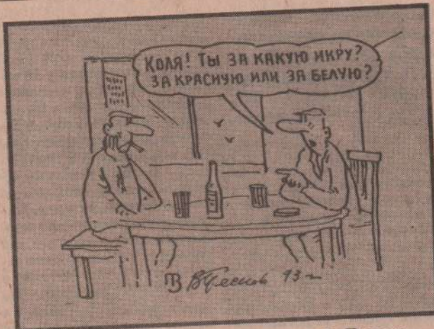
Рисунки В. Пескова.