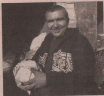
«Родина», ИП Суаридзе, «Смолинские ключики», Каменское РайПО.

района: «Настроение отличное, погода - восхитительная, - делятся впечатлениями представители ОАО «Каменское». - Сегодня мы представили широкий ассортимент нашей продукции: пшеницу, овес, морковь, картофель... Причем все по приемлемым ценам». Горожане мешками раскупали капусту из СХП «Исетское» - буквально через пару часов товара уже не осталось. От нашего района в ярмарке участвовали также представители таких сельхозпредприятий, как «Покровское», ООО