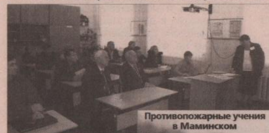
Противопожарные учения в Маминском