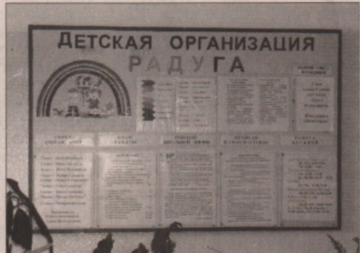
ДЕТСКАЯ ОРГАНИЗАЦИЯ РАДУГА