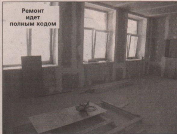
Ремонт идет полным ходом