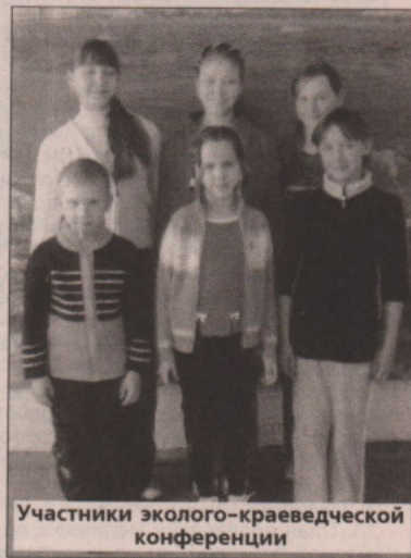
Участники эколого-краеведческой конференции