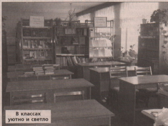
В классах уютно и светло