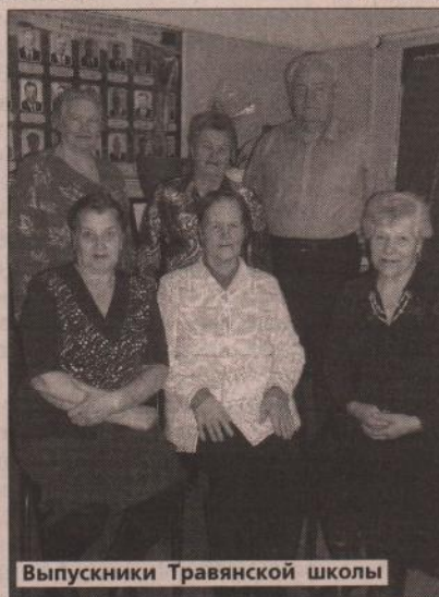
Выпускники Травянской школы