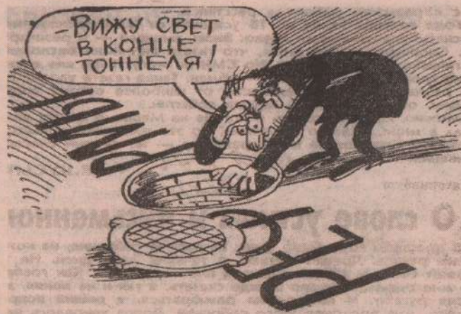
Рис. Л. ЧЕРНЫХ

Полоса подготовлена по материалам российских и зарубежных СМИ.