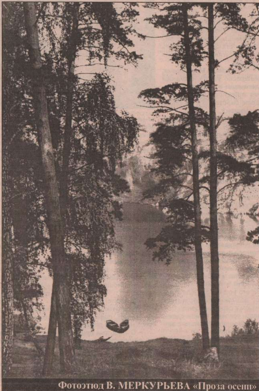
Фотоэпюд В. МЕРКУРЬЕВА «Проза осени»

Ждем вас по адресу: ул. Каменская, 8, каб. 20. Каждый четверг в 18.00.