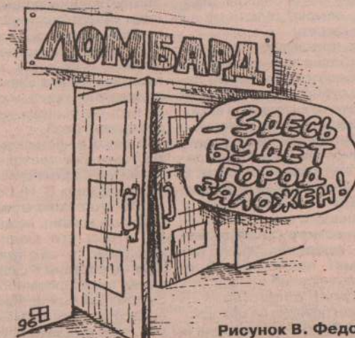
Рисунок В. Федорова.