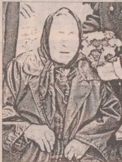
Большинство пророчеств Ванги весьма туманны. И все же они гораздо яснее, чем у того же Нострадамуса. По крайней мере для толкователей.

Дар предвидения действительно существует?