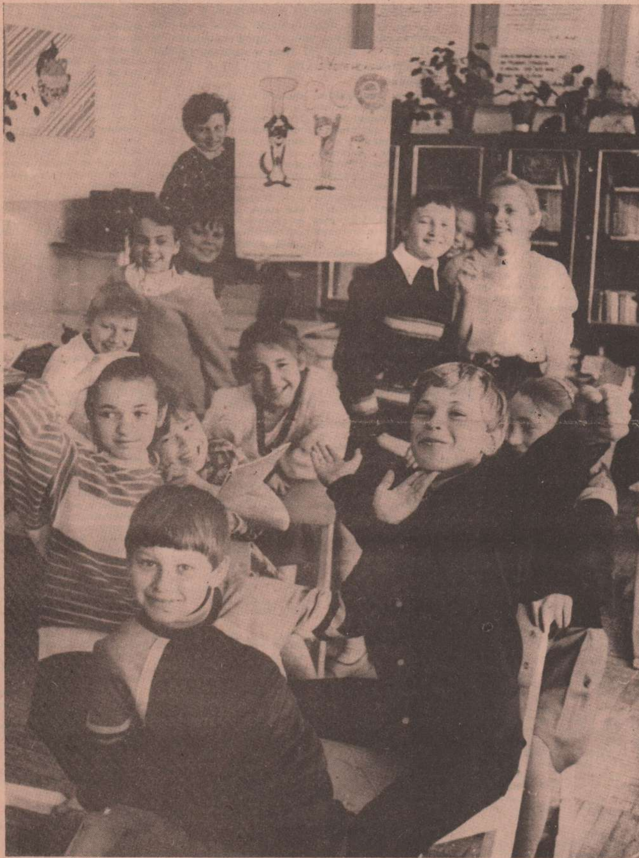
На снимке: мальчишки и девчонки из театрального кружка Бродовской средней школы.