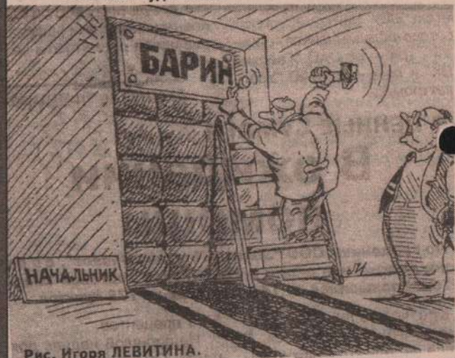
Рис. Игоря ЛЕВИТИНА.

Полоса подготовлена по материалам российских и зарубежных СМИ.