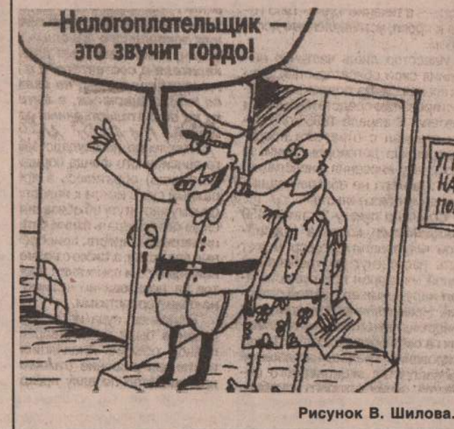
Рисунок В. Шиловой.

елами. Причем наличные деньги, указанные в декларации, не могут превышать 1000-кратного МРОТ на момент составления декларации. К данной декларации прилагаются все документы или их наличные деньги, указанные в декларации, не могут превышать 1000-кратного МРОТ на момент составления декларации. К данной декларации прилагаются все документы или их копии, подтверждающие заявленное у декларации имущество. Нотариус, принявший на хранение такую декларацию обязан выдать гражданину свидетельство и уведомить об этом налоговый орган по месту жительства гражданина о составлении такой декларации об имуществе.