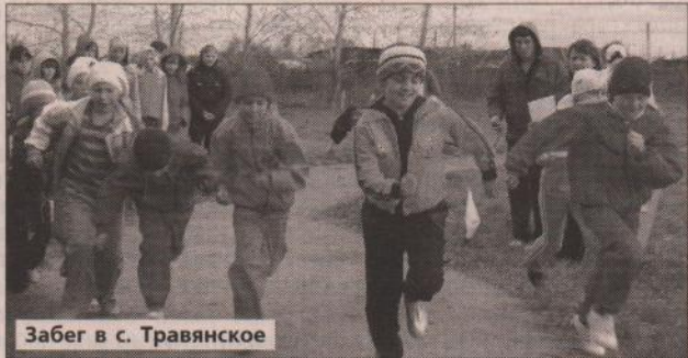
Забег в с. Травянское