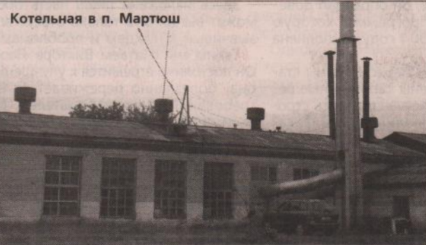
Котельная в п. Мартюш

Главной проблемой сегодня является запуск газовых котельных. Их в районе большинство. Газовики готовы пустить «голубое топливо», но опять же при условии муниципальных гарантий. Вышеуказанная задолженность по газу должна быть погашена предприятиями ЖКХ в течение двух ближайших месяцев. И район вновь намерен взять на себя обязательства. Другого выхода нет. Поэтому на заседании думцы приняли решение дать газовикам муниципальную гарантию. Это значит, что в ближайшие дни