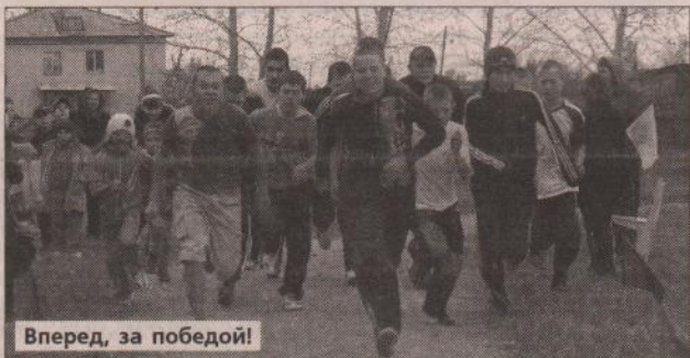
Вперед, за победой!