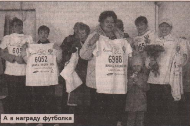
А в награду футболка