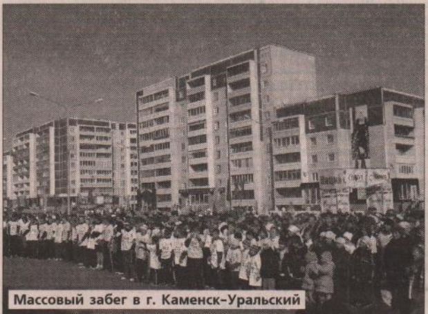
Массовый забег в г. Каменск-Уральский