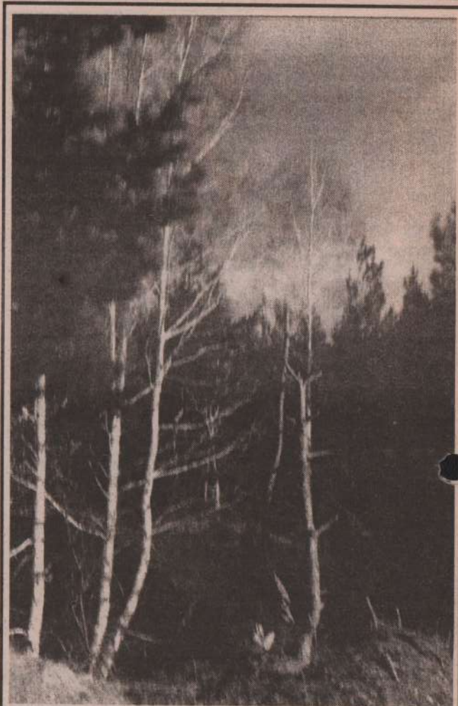
Лес — источник здоровья.

Мед растопить в эмалированной кастрюле, не давая ему вскипеть, добавить алоэ и дать покипеть 5-10 минут на слабом огне. Отдельно в 2-х стаканах воды заварить березовые почки и цветы липы, кипятить на слабом огне 3 минуты. Настоять 15-20 минут, отжать, когда мед остынет, влить в