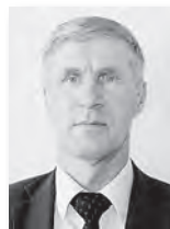
Михаил Копытов, министр АПК и продовольствия Свердловской области:

«Мы ежегодно улучшаем показатели и постоянно находимся в десятке лучших производителей молока в России. Это происходит благодаря стабильной, увеличивающейся с каждым годом областной и государственной поддержке животноводов, грамотной политике, которую ведут руководители сельхозпредприятий в области кормозаготовки и созданию генетического потенциала крупного рогатого скота на Урале».