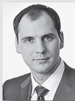
Денис Паслер, председатель регионального правительства:

«Ежегодно пожарно-спасательные подразделения региона ликвидируют более 10 тысяч пожаров и возгораний, десятки чрезвычайных ситуаций; спасают жизни тысяч жителей и материальные ценности на десятки миллионов рублей. Много делается в регионе для создания достойных условий работы сотрудников противопожарной службы. Строятся и реконструируются здания пожарных депо, приобретаются новейшие машины и оборудование, создаются новые подразделения в населенных пунктах».