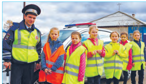
Группа по пропаганде ОГИБДД Каменска-Уральского

Также юные инспекторы раздавали всем участникам дорожного движения памятки. Ребята вместе с сотрудником Госавтоинспекции проводили профилактические беседы с водителями, напоминая им о необходимости соблюдать скоростной режим и быть предельно внимательными вблизи пешеходных переходов. Еще ребята рекомендовали водителям вовремя менять шины и подготовить свой автомобиль к первым заморозкам. Юные инспекторы движения общались с водителями и пешеходами, призывая строго и неукоснительно соблюдать правила дорожного движения.