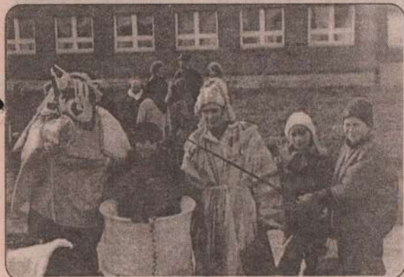
На снимках А. Пьянкова участники ярмарки