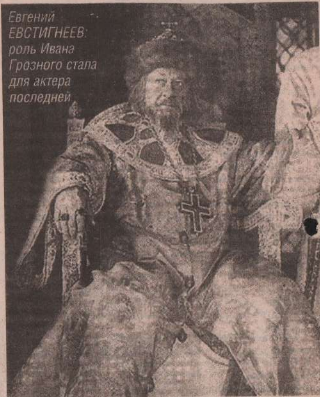
Евгений ЕВСТИГНЕЕВ: роль Ивана Грозного стала для актера последней