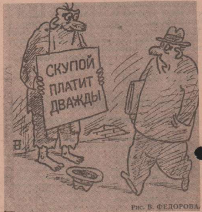
Рис. В. ФЕДОРОВА