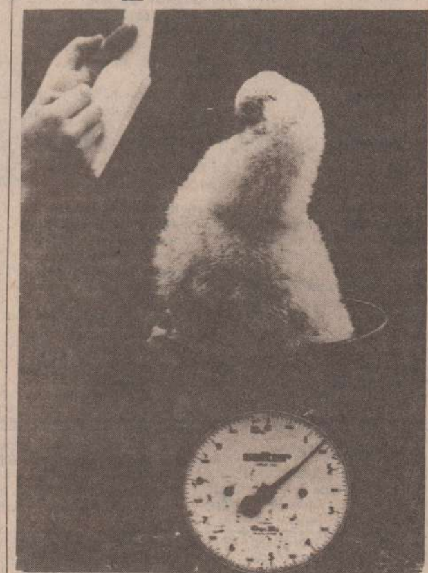
А НУ, НА СКОЛЬКО Я ПРИБАВИЛ?!