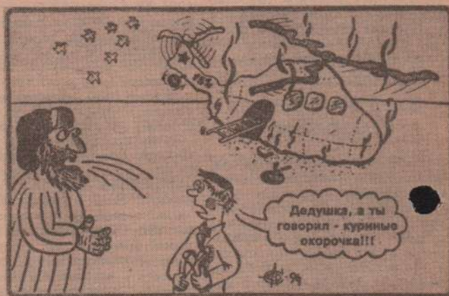
Рис. О. СЫРОМЯТНИКОВА.