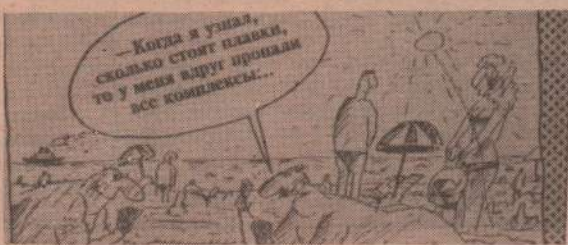
Рисунок В. Федорова.