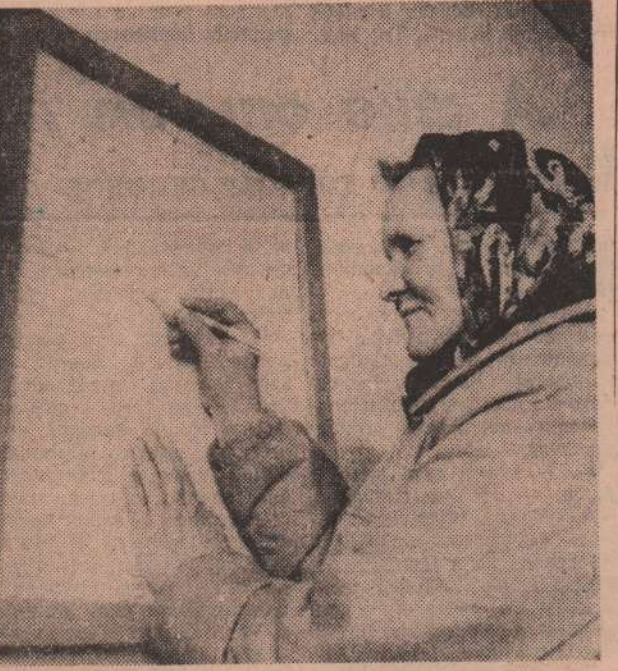
равне ее чуткость, доброжелательность к людям. Наверное, поэтому уже много лет подряд избирают ее товарищи в