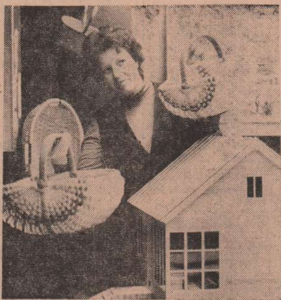
Среди товаров массового спроса, выпускаемых предприятиями Свердловской области, большое место занимают изделия из дерева. Это наборы мебели, строительные материалы, хлебницы, посуда; всевозможные лукошки для ягод и грибов.

И не будет Больно людям? Не страшен стресс? Удивляюсь, восторгаюсь Тобой, Прогресс! Но уж пусть во мне живое Отболит за все, отнюет Сердце — что хоть и большое! — Какое есть..