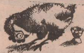
Рисунок С. Аруханова.