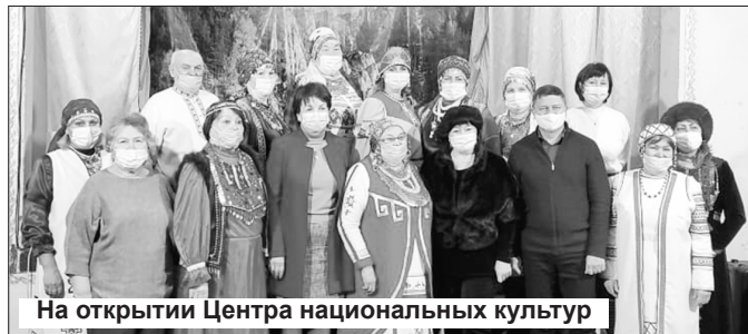
На открытии Центра национальных культур

национальные объединения, которые хорошо заявили о себе. К примеру, клуб чувашских друзей «Туслах», любительские объединения удмуртской культуры в Сосновском и Мартюше, башкиро-татарской культуры в Новом Быту и другие. В них предполагается привлекать новых представителей, оказывать методическую поддержку, – рассказывает О.П. Вольф. – В ближайшее время планируется создать клубы русской культуры «Родники» и цыганской культуры «Ромалы», а также объединить всех украинцев в клуб