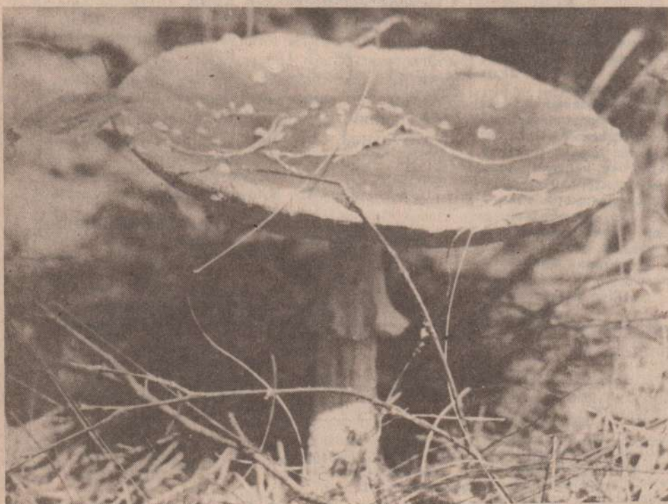
Грибной шеголь — мухомор.