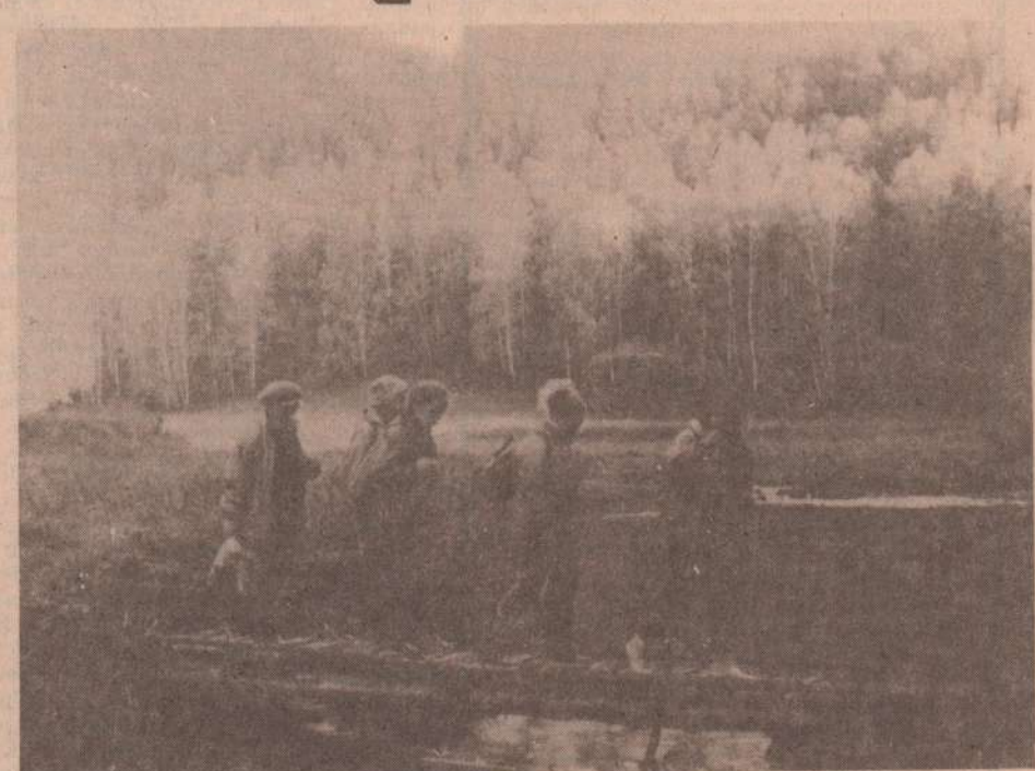
В походе только девушки.