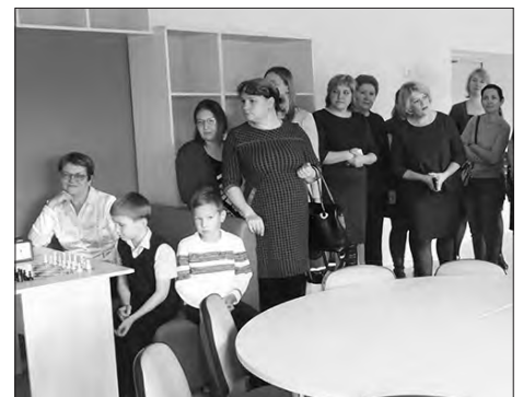
На открытии «Точки роста» в Каменской школе