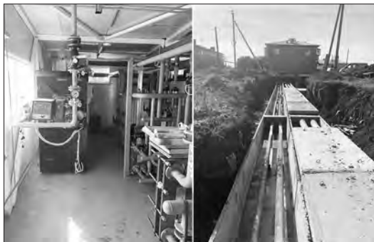
Газовая котельная в Травянском готовится к запуску