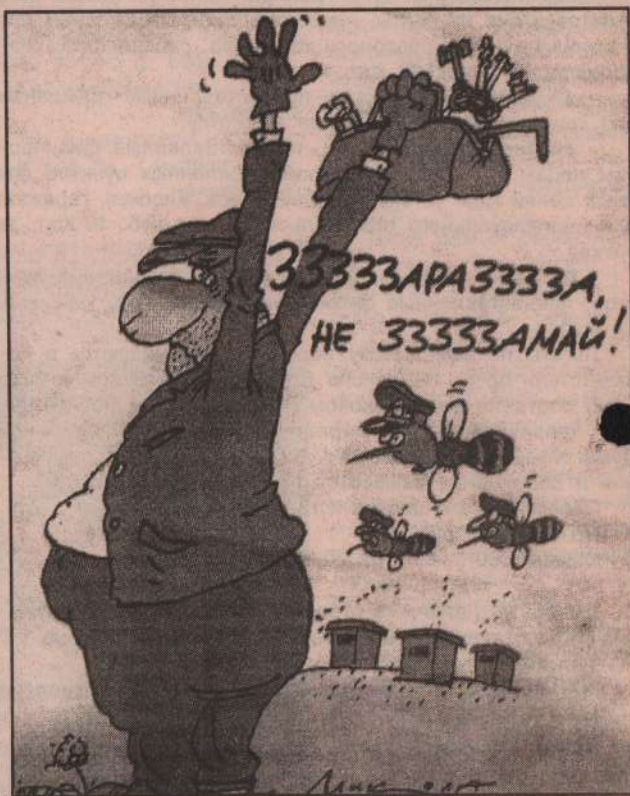
Рисунок Н. Воронцов

шло не в отделение, а в больницу, где он лечился целый месяц. Все это время коллеги милиционеров потешались над незадачливым преступником, нахваливая находчивость двух оперов. Да вот только начальство ее не оценило - влепило им по «строгачу». Оказалось, что пасека принадлежала большому районному начальнику, которого мало волновали проблемы угрозыска. Так ведь можно и совсем без меда остаться. Проблемам «пасечник» поделился с начальником отделения, а тот, посочувствовав, наказал подчиненных.