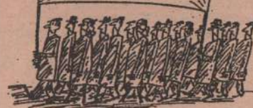
Рис. Ю. РУМЯНЦЕВА (г. Владимир).

ПОСКОЛЬКУ ДЕНЬГИ ДАЮТ ТОЛЬКО ПЕРЕД ВЫБОРАМИ, ТРЕБУЕМ ИХ ПРОВЕДЕНИЯ 5 И 25 ЧИСЛА КАЖДОГО МЕСЯЦА!