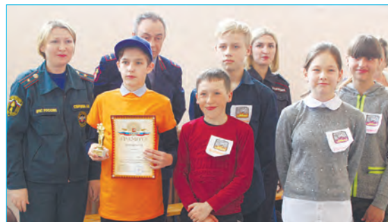
Ребята показали эрудицию на тему безопасности жизнедеятельности

В игре приняли участие обучающиеся 5, 6 и 7 классов. Свои знания, умения, навыки показали 6 команд. Ребята с удовольствием отвечали на вопросы по дорожной безопасности, истории ВДПО, на скорость оказывали первую помощь, соорудили водонапорную башню, представляли свою команду, показывали свою эрудицию в знаниях подразделений МВД и воинских званий. Лучшими стали ребята из команды «Экстремалы» из 6-го класса. Особую благодарность коллектив школы выражает