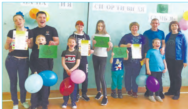
В этих состязаниях проигравших не было