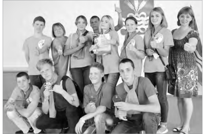
В 2018 г. победителем молодежной вахты стал отряд «Новое поколение» из Маминского

В рамках областной программы по патриотическому воспитанию граждан будут трудоустроены почти две сотни несовершеннолетних жителей района. По линии управления культуры, спорта и делам молодежи обеспечат работой 50 подростков, проживающих в Маминском, Покровском, Позарихе. Управление образования берется трудоустроить 119 несовершеннолетних, организовав молодежные трудовые отряды в Мартюше, Травянском, Колчедане, Покровском. Координировать работу будут главы сельских администраций. Отряды трудовой вахты получают задания, связанные с благоустройством сел и деревень, поддержанием чистоты и порядка на территории улиц и дворов населенных пунктов, благоустройством лесопарковых зон, обелисков. Ребятам также будет предложено навести порядок после ремонта в школах, учреждениях культуры и дополнительного образования. В критерий оценки деятельности трудовых отрядов обязательно входит их участие в общественной жизни района, сельских территорий.