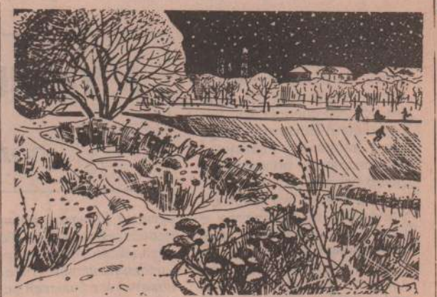
Рисунок Т. Белоусовой.