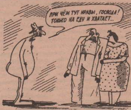
Рис. Михаила ЛАРИЧЕВА.