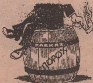
Рис. Л. ЧЕРНЫХ.